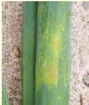
写真④ 黄色斑紋病斑

黄色斑紋病斑は、15〜20℃のや や低い温度と多湿で発生しやす くなります。曇天や土寄せで根が 切れることによる草勢の低下や、 取り遅れによる老化も発生を助 長します。