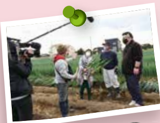
「おはよう日本」の撮影風景

©11~12月は「九十九里海っ子ねぎ」がテレビやラジオなどで紹介されました。12月11日放送のNHK総合「おはよう日本」では、リポーターが収穫したてのネギを食べて、みずみずしさと甘さに驚いていました。私も便乗してガブリっ！ネギの丸かじりは初めてでしたが、ホントに甘かった！まさに今が旬のネギ。たくさん食べて、新しい年も元気に過ごしたいと思います♪