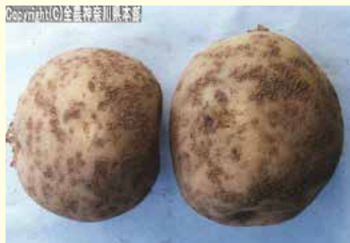
写真② バレイショのそうか病

放線菌による被害で、中心がくぼんだカサブタ上の病斑が発生します(写真②)。高温、乾燥条件で発生しやすく、土壌pH6.5以上で多発するので、高い圃場では作付けを控え、土壌診断を行いましょ。