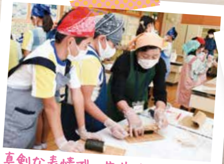
真剣な表情で、先生から巻き方を教わっています!