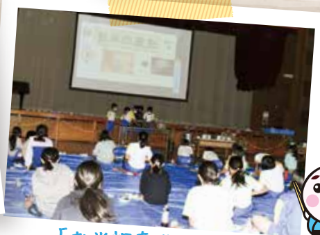
「お米調査隊」の学習発表!!