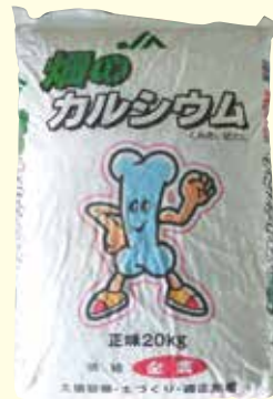
写真① 畑のカルシウム

「畑のカルシウム」は品質向上、増収効果を目的とした土壌改良資材で、土壌pHを変化させずにカルシウムを補給できるので、お勤めの石灰資材です(写真①)。