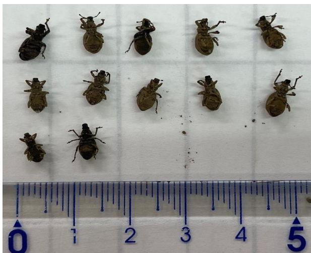
捕獲されたヒョウタンゾウムシ

朝晩は肌寒いですが、日中の気温が高めに推移しているため、例年よりもゾウムシの活動時期が早く、捕獲数は増加傾向にあります。