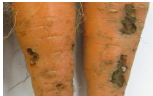
ヒョウタンゾウムシの幼虫による食

【ニンジンのヒョウタンゾウムシ防除薬剤】 コテツフロアブル 2000倍 収穫前日まで 2回以内 ※成虫にかかるように散布