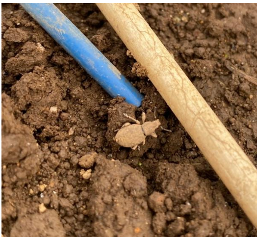
圃場に侵入する ヒョウタンゾウムシ成虫

ヒョウタンゾウムシの捕獲頭数は減少傾向にありましたが、増加傾向に転じています。今後の気象情報では、概ね晴天が続き、最高気温が20℃を超える日が続く予報です。ヒョウタンゾウムシの成虫の侵入が増加すると予想されますので、下記、薬剤にて防除を行いましょう。